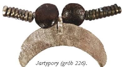
Jartypory (grób 226). Srebrna zawieszka