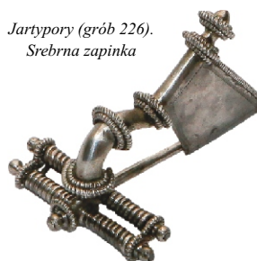
Jartypory (grób 226). Srebrna zapinka